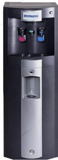
Álló hideg- és meleg víz adagoló berendezés (vízadagoló)